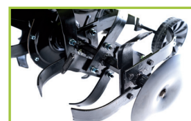
Eje de fresas hexagonal